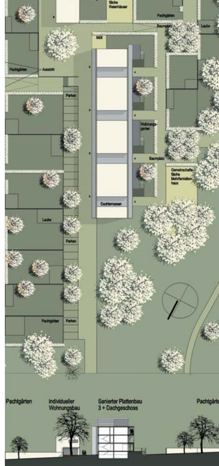
◀ Grüne Aussichten für Rudolstadt (Thüringen): 1. Preis im GRW-Wettbewerb