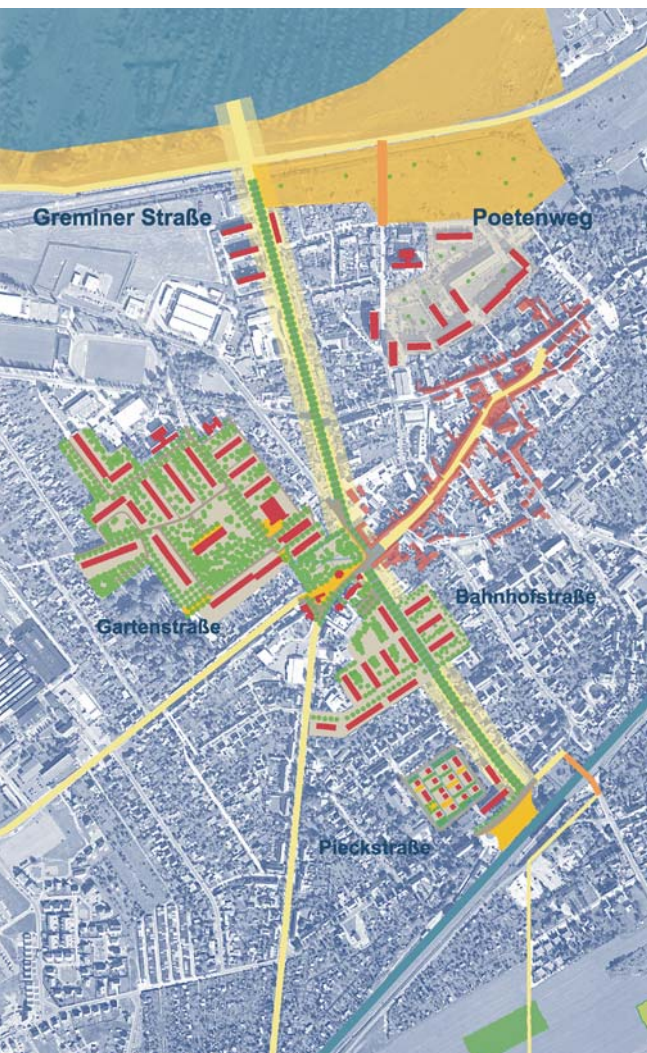
▲ Stadtentwicklungskonzept Gräfenhainichen (Sachsen-Anhalt): 1. Preis im Bundeswettbewerb Stadttumbau Ost

»Stadttumbau« ist eine der vielschichtigsten Planungsaufgaben der nächsten Jahre. Im Gegensatz zu den bisher üblichen städtebaulichen Planungen bedarf es beim Stadttumbau gänzlich neuer Verfahren und visionärer Ansätze. Bei der Erarbeitung von integrierten Stadtentwicklungskonzepten sind Landschaftsarchitekten die Partner für Kommunen und Wohnungswirtschaft, denn: Gute Freiräume qualifizieren den Stadtraum.