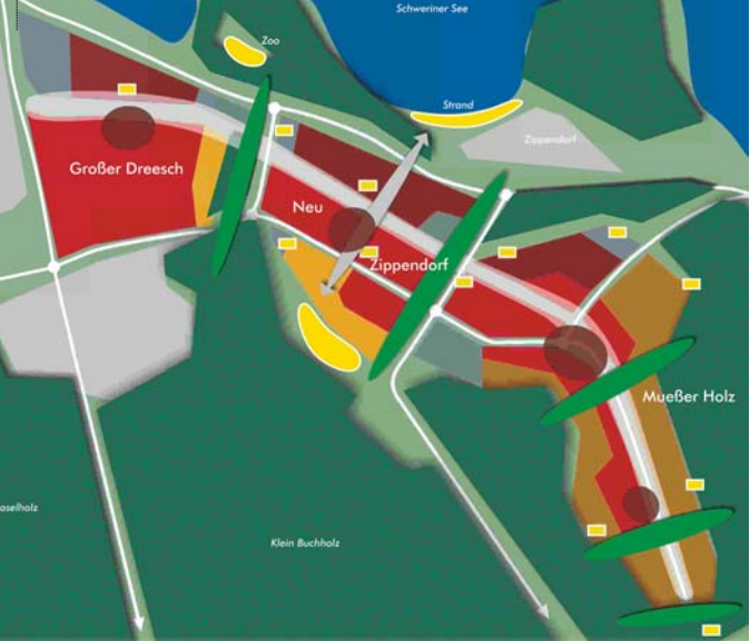
◀ Räumliches Leitmodell Schwerin: 1. Preis im Bundeswettbewerb Stadttumbau Ost