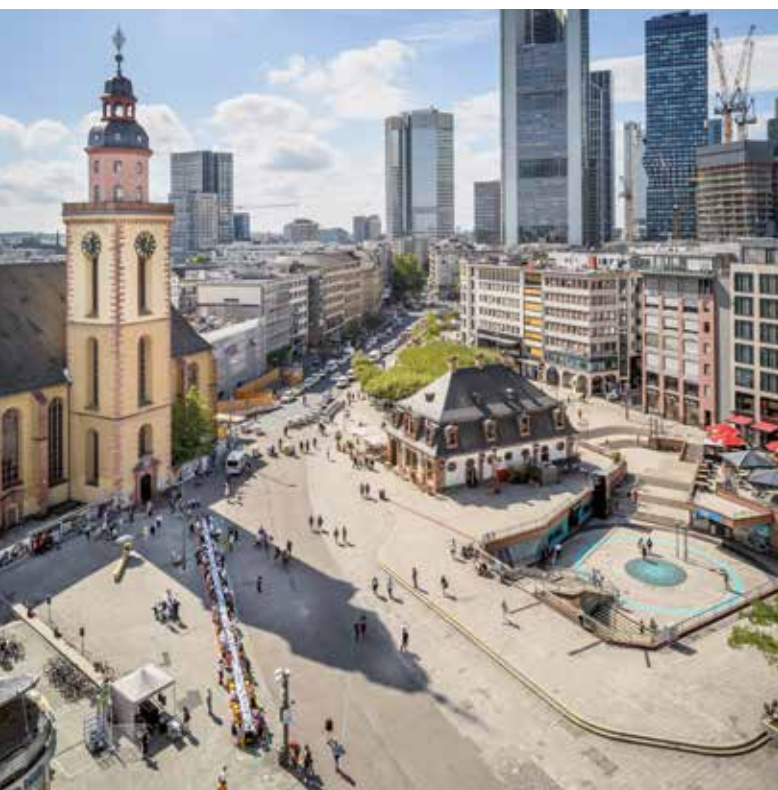
Eröffnung Opening DAM Reallabor „Wohnzimmer Hauptwache“ 2022, Foto Photo: Moritz Bernouilly

These and other protest movements starting with the 19th century — when protests were frequent — and continuing through to climate activists’ ongoing gluing activities will be presented in a new additional exhibition space of 1,000 square meters in DAM Ostend. The exhibition display was developed by Something Fantastic. A film installation by director Oliver Hardt is being produced in cooperation with the Wüstenrot Foundation. Funded by the Kulturstiftung des Bundes (German Federal Cultural Foundation). Funded by the Beauftragte der Bundesregierung für Kultur und Medien (Federal Government Commissioner for Culture and Media).