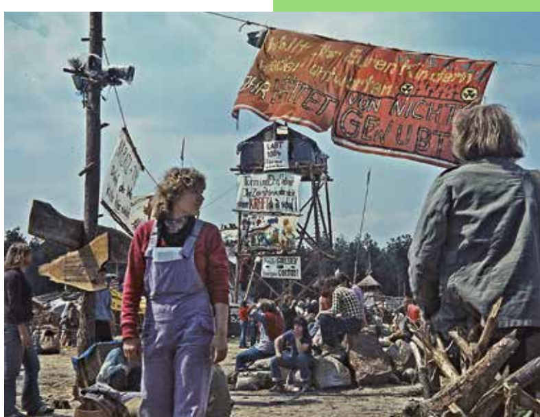
Protestcamp „Republik Freies Wendland“, Gorleben, 1980; Protest camp “Free Republic of Wendland”; Gorleben, 1980

Diese und andere Protestbewegungen zwischen dem barrikadenreichen 19. Jahrhundert und den aktuellen Klimaklebeaktionen werden auf einer zusätzlichen, um 1000 Quadratmeter erweiterten Ausstellungsfläche im DAM Ostend vorgestellt. Die Ausstellungsarchitektur wurde von Something Fantastic entwickelt. Eine Filminstallation des Regisseurs Oliver Hardt entsteht in Kooperation mit der Wüstenrot Stiftung. Die Ausstellung wird gefördert durch die Kulturstiftung des Bundes, diese wird gefördert von der Beauftragten der Bundesregierung für Kultur und Medien.