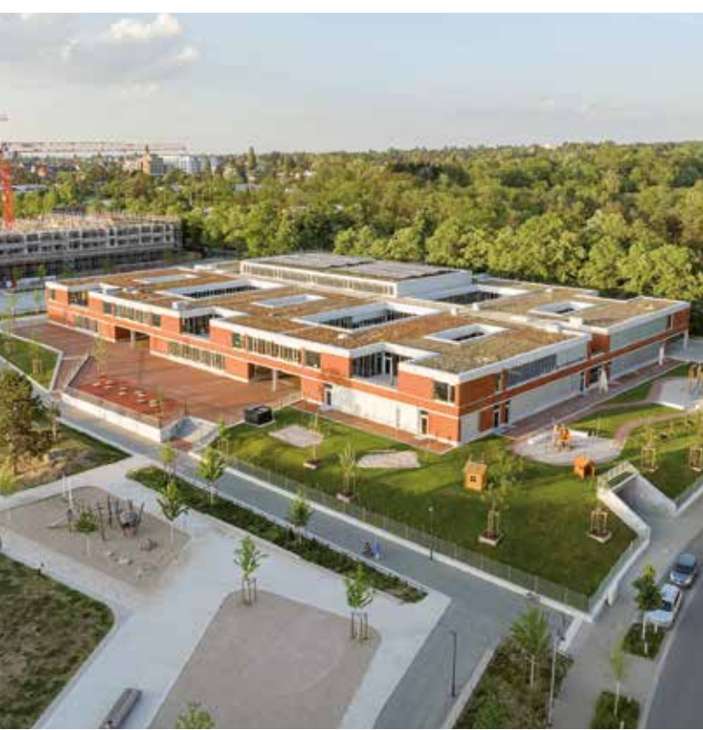
Waechter+Waechter Architekten, Darmstadt und foundation 5 + landschaftsarchitekten, Kassel

ALFONS MARIA ARNS, Kulturhistoriker 6. Dezember 2023