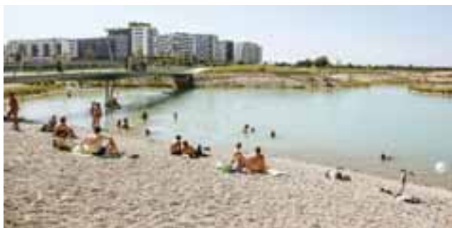
Sowohl der Seepark mit seinem kristallblauen Bagger-See als auch der Yella-Hertzka-Park mit unterschiedlichen Nutzungsangeboten wurde von den Bewohnern schnell adaptiert.

Die Modellierung des Parks ist so angelegt, dass durch eine leichte, aber deutliche Topographie zwar unterschiedliche Teilräume im Park entstehen, aber keine uneinsehbaren »Angst-Räume«. Der un-