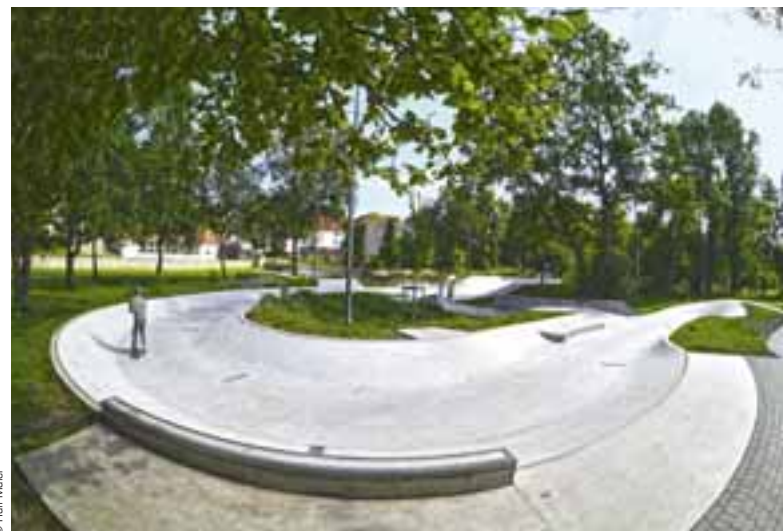
Dank einer zentralen Lage im Stadtgebiet wird eine Nutzung als außerschulischer Lernort begünstigt.

Insgesamt konnte eine Begegnungsstätte in der Almeaue geschaffen werden, die der sportlichen Betätigung und sozialen Interaktion dient. Dank einer zentralen Lage im Stadtgebiet kann zudem eine Nutzung als außerschulischer Lernort begünstigt werden.