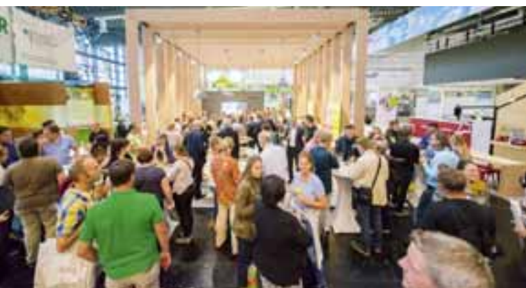
Zum Empfang am Abend des 15. September 2022 erwarten bdla und NürnbergMesse erneut gut 100 Gäste wie 2018.

zum dritten Mal in Folge auf der internationalen Leitmesse für Planung, Bau und Pflege von Urban- und Grünräumen am eigenen Messtand in der Halle 3A.