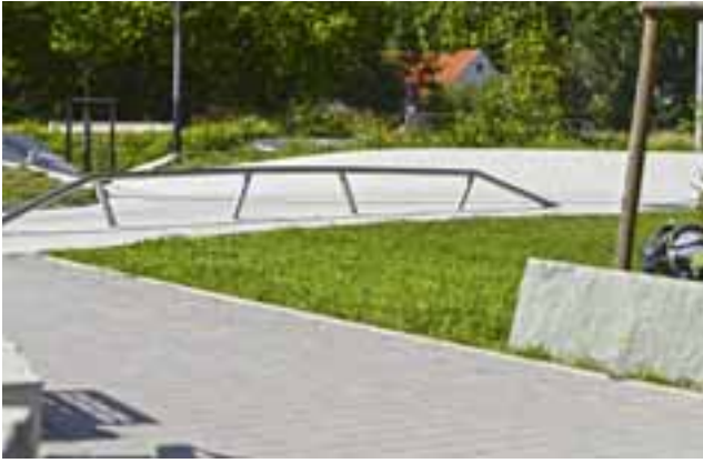
Anlage ist barrierefrei zugänglich, sodass eine Wettkampfbefähigung im Rollstuhlsport möglich ist.