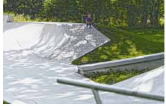
Zuschauen kann auch mal schön sein.

der Einbringung eines gutes »Flows« konnte das erreicht werden. Durch das Einbringen von flachen Rampen ist es uns zum Beispiel gelungen, auch junge Nutzer:innen anzulocken, die die Anlage beispielsweise mit ihrem Skateboard oder ihrem Laufrad/Fahrrad erkunden. Das kann dabei helfen, die motorischen Fähigkeiten der Kinder weiterzuentwickeln. Und durch den Austausch, das Zusammenspiel mit anderen Nutzer:innen in der Anlage kann zudem die Sozialkomponente gestärkt werden.