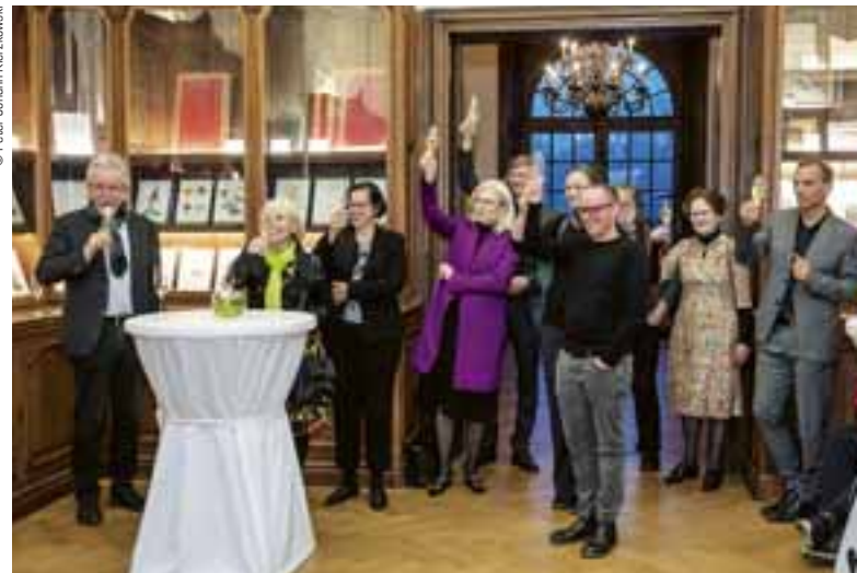
Ein Hoch auf das neue bdla-Ehrenmitglied.

schaftsarchitekt:innen »auf Cent und Euro« nach- und werthaltig platzieren konnte.