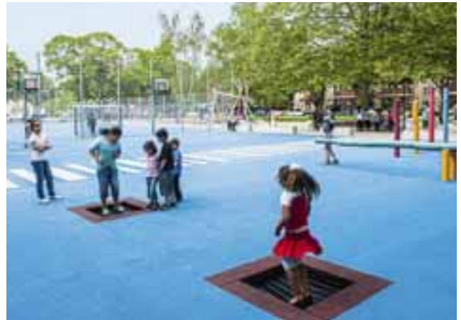
Sport- und Spielbereich im Letteplatz, Berlin.