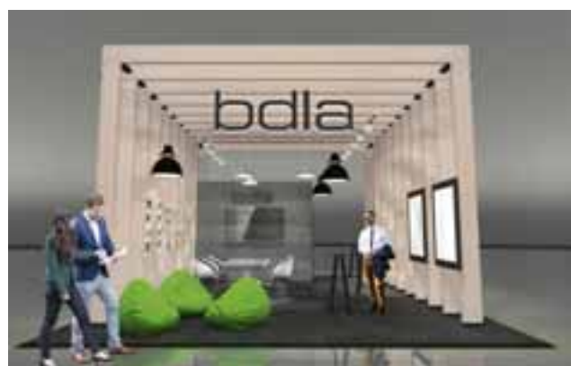
Am bdla-Stand auf der GaLaBau 2022.

Am letzten Messetag sind erfahrungsgemäß zahlreiche Privatbesucher:innen in den Messehallen technischen Innovationen, Pflanzenneuheiten und der Profession auf der Spur. Orientiert an dieser Klientel präsentiert der bdla erstmals das vom Verband herausgegebene, druckfrische Pixi-Heft »Landschaftsarchitektin Lena plant einen Park für alle«. Mit dem Pixi-Heft soll Kindern der Altersgruppe