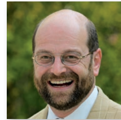
Volker Godel Bürgermeister Ingersheim