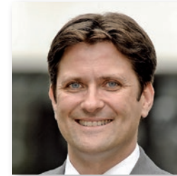
Dirk Schaible Bürgermeister Freiberg am Neckar